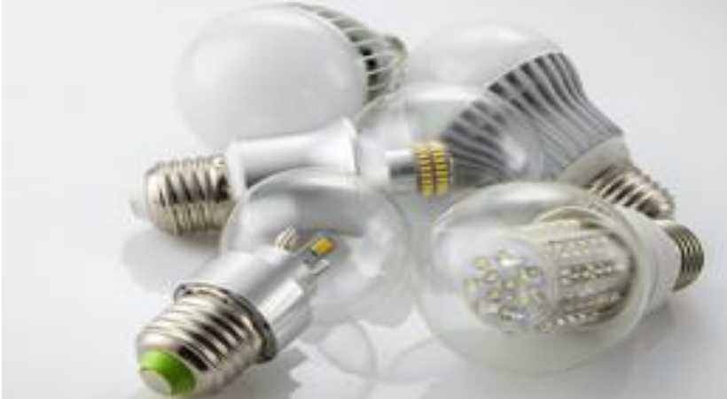
从使用 LED 灯泡能够大幅降低耗电量

来自 Agora 能源转型委员会的建议：应该激励市政部门及其他能源企业为他们的客户安装节能设备。