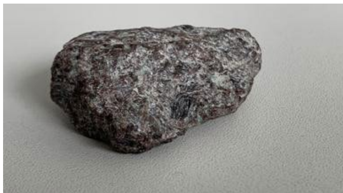
电-热储能装置所用的火山岩石块