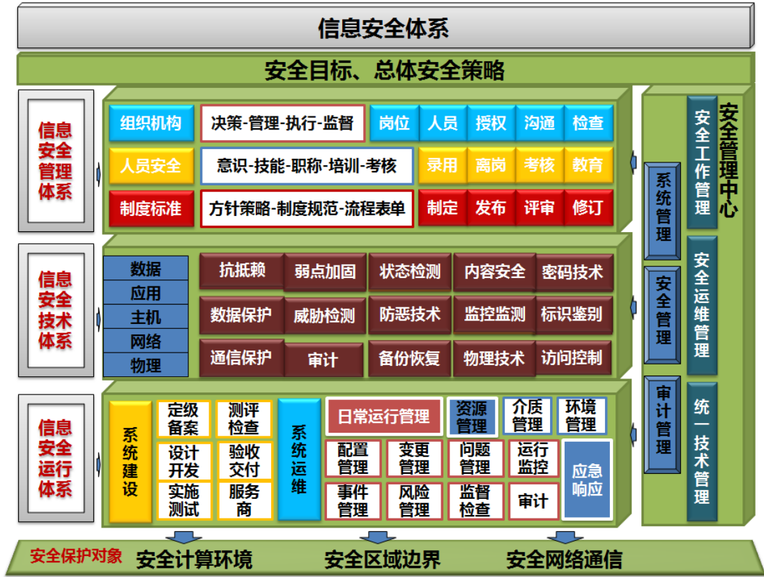
图 2 总体安全防护框架图

能耗在线监测系统安全防护设计应采用“安全域纵深防护”、“多层次立体防御”及“信息安全等级保护”相结合，从系统（或设备）所在的计算环境、区域边界、通信网络、安全管理以及物理安全等多层面部署安全保障措施，满足不同等级系统在技术、管理各层面防护要求，通过建立安全管理中心，实现数据、系统、网络等安全交换和关联分析管理，保障同级系统内部、跨级系统区域安全互联的安全。