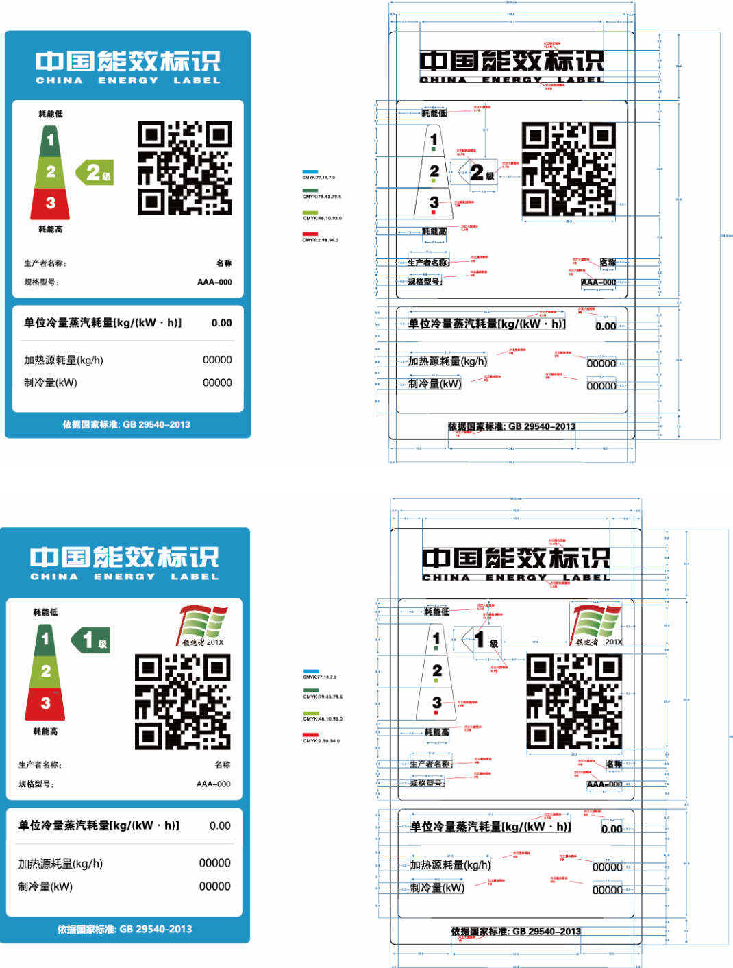
图 1 蒸汽型溴化锂吸收式冷水机组